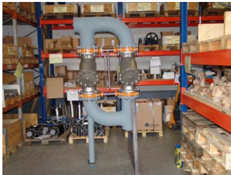
Umschalteinheit für Schmutzfänger